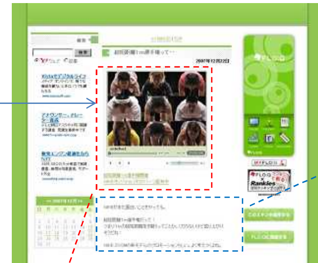
<投稿したユーザーのブログ>