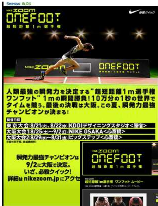
<タイアップページ>

ワンクリック簡単操作で動画をブログに設置 プロガーのクチコミにより多くのユーザーに動画を視聴してもらうことができます。